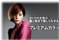
オトナの女性の 髪と肌まで美しくみせる プレミアムカラー